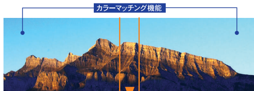
カラーマッチング機能