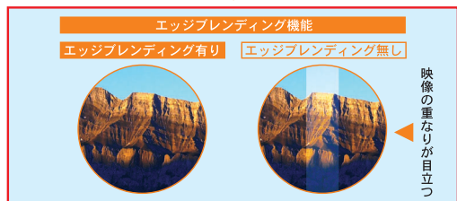
エッジブレンディング機能