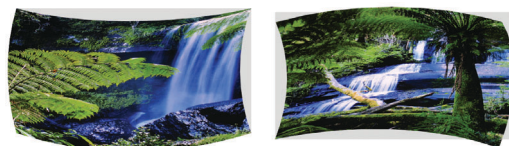
幾何学補正機能のイメージ

お客様の使用環境や用途に合わせた最適のご提案をさせていただきます。またアプリケーションに合わせたカスタマイズにも対応させていただきます。