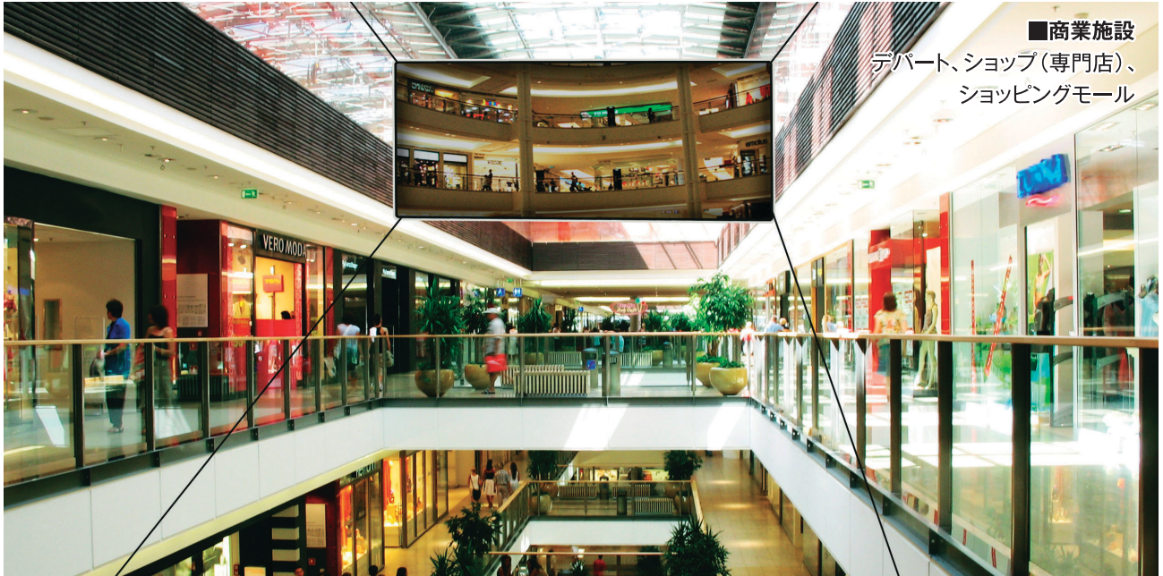
■商業施設 デパート、ショップ(専門店)、 ショッピングモール

■冠婚葬祭施設 結婚式場、レストラン、葬儀場 ■文化施設 美術館、博物館、図書館