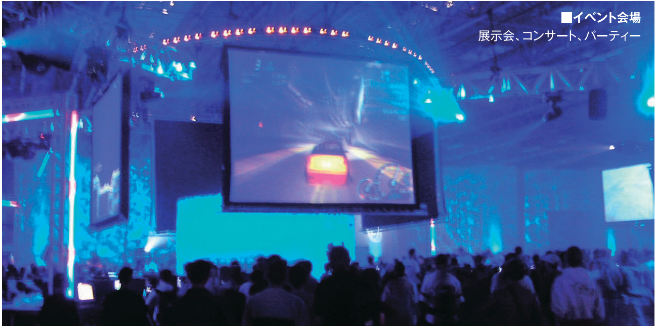
■イベント会場 展示会、コンサート、パーティー